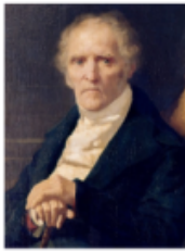
Charles Fourier (1772-1837)