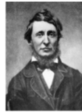
Henry David Thoreau (1817-1862)