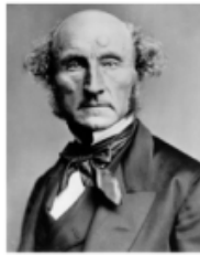
John Stuart Mill (1806-1873)