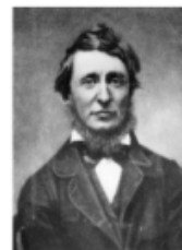
Henry David Thoreau (1817-1862)