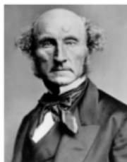
John Stuart Mill (1806-1873)