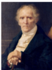
Charles Fourier (1772-1837)