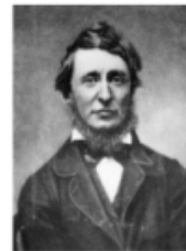
Henry David Thoreau (1817-1862)