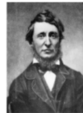
Henry David Thoreau (1817-1862)