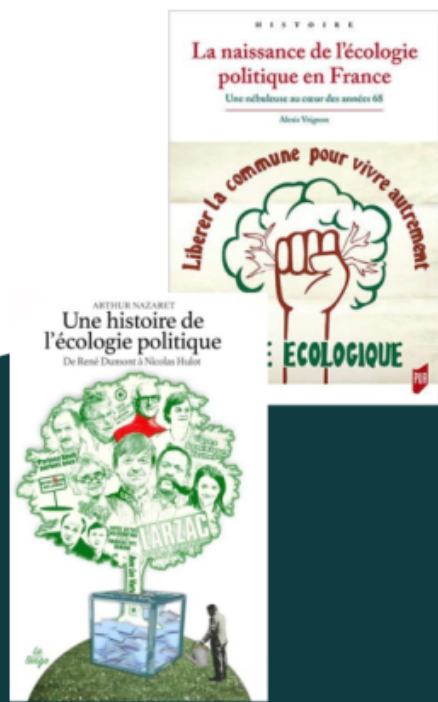
Une des pages de la présentation de David Cormand lors de la soirée du 3 novembre 2025 auprès du groupe local Les Écologistes de Malakoff

Post by @LesEcologistesMalakoff@paille.fr