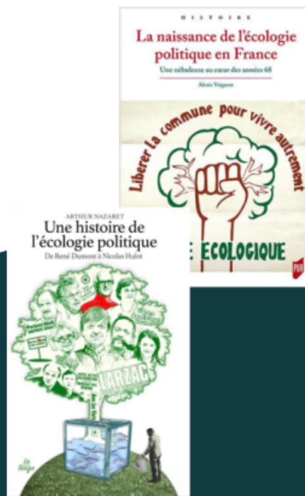
Une des pages de la présentation de David Cormand lors de la soirée du 3 novembre 2025 auprès du groupe local Les Écologistes de Malakoff

Post by @LesEcologistesMalakoff@paille.fr