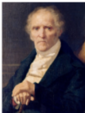
Charles Fourier (1772-1837)