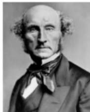
John Stuart Mill (1806-1873)