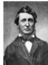
Henry David Thoreau (1817-1862)