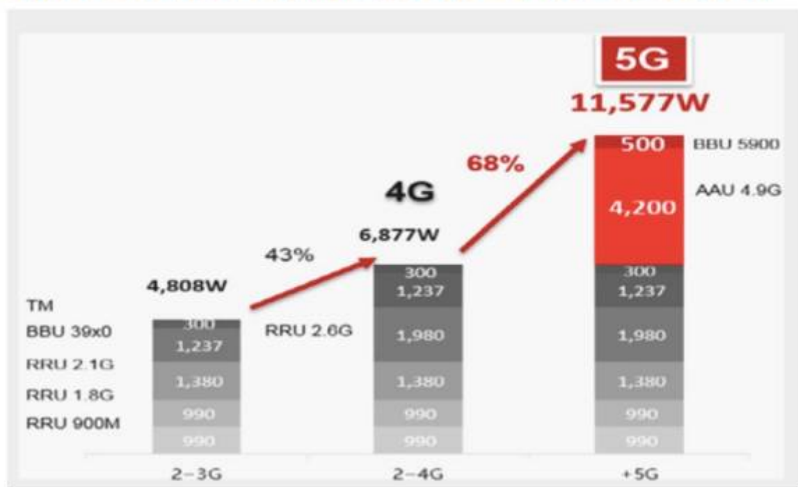
Figure 5: Site power requirements, 2G, 2-4G, and 5G (per Huawei)

Avec le déploiement des premiers réseaux 5G, il apparaît que la plupart des objectifs annoncés se concrétisent, ou ne tarderont pas à l'être... A part un, qui n'est définitivement pas atteint : celui de la réduction de la consommation électrique. 4)