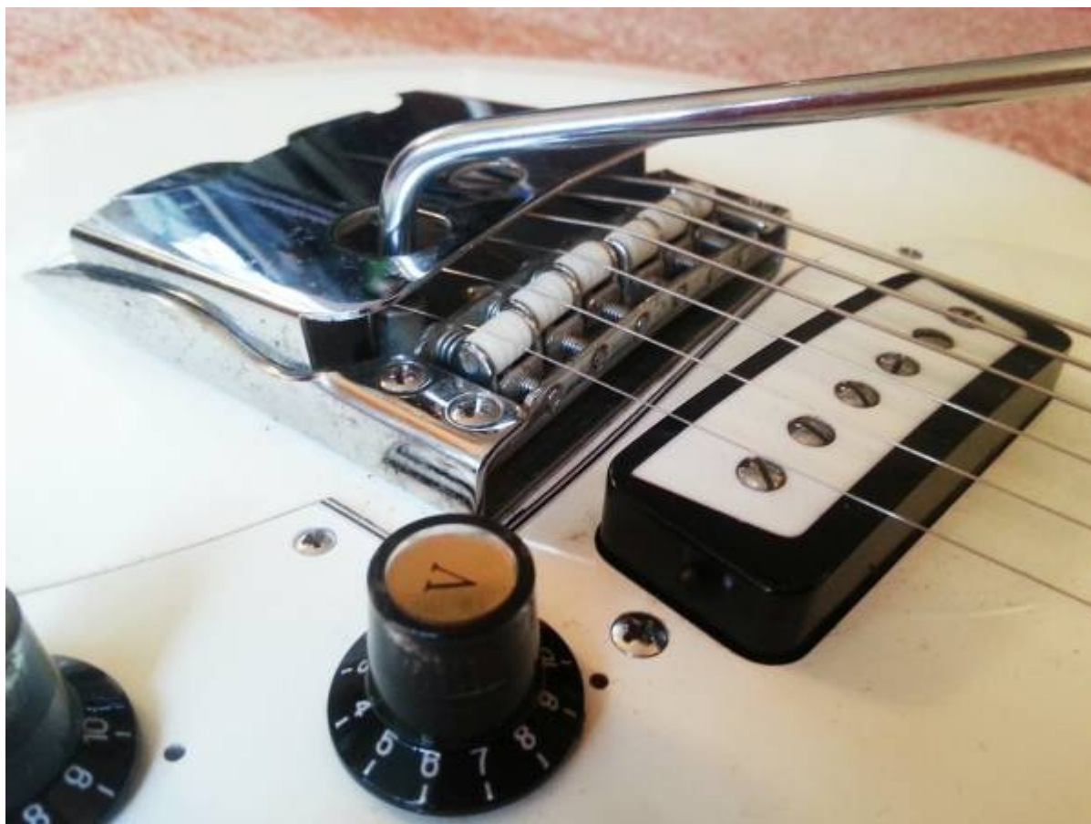
Guitare Aria 1802T, gros plan sur le système de trémolo

un capot façon "cendrier" (qui fait penser aux telecasters, pour le coup), un potentiomètre de volume et un autre de tonalité, et ce tout petit switch noir à deux positions qui ajoute un gros plus à l'instrument. Il permet en effet de changer l'organisation du circuit électrique des micros, pour booster leurs sonorités. Du coup, on passe de sons typés stratocaster à des sons qui se rapprochent plus des micros humbuckers des Gibson.