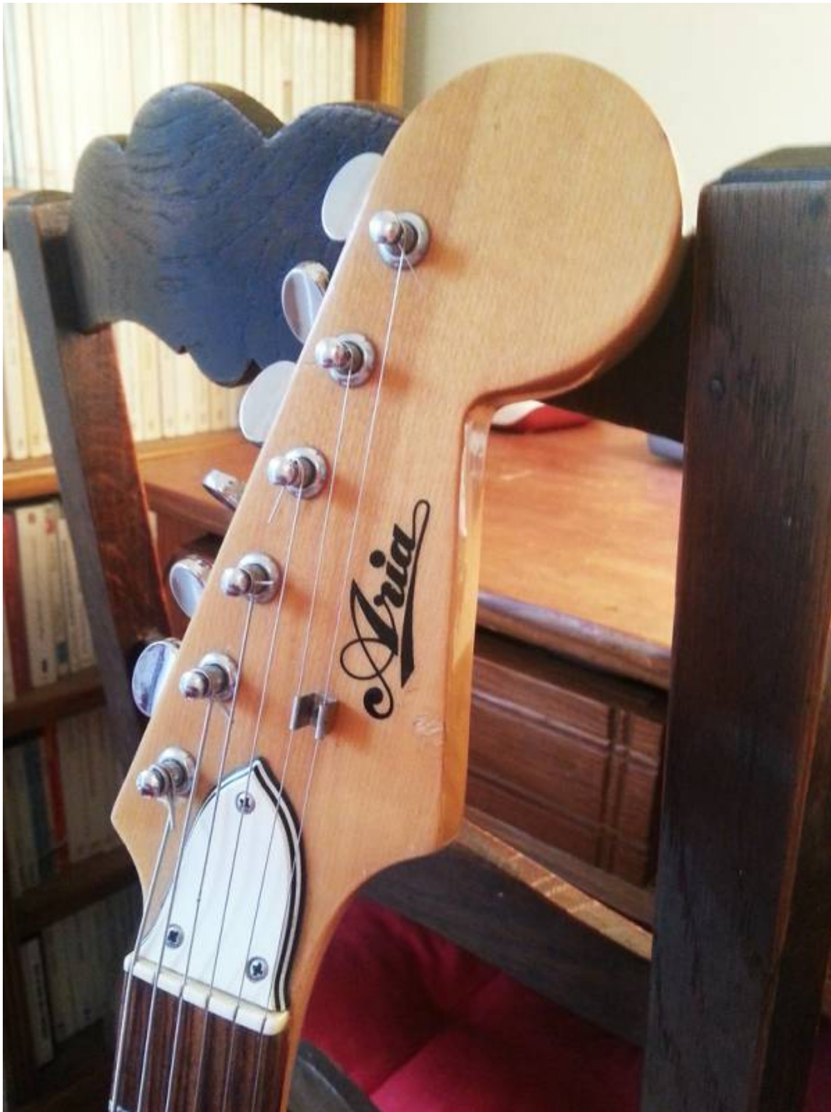
Guitare Aria 1802T, gros plan sur la tête