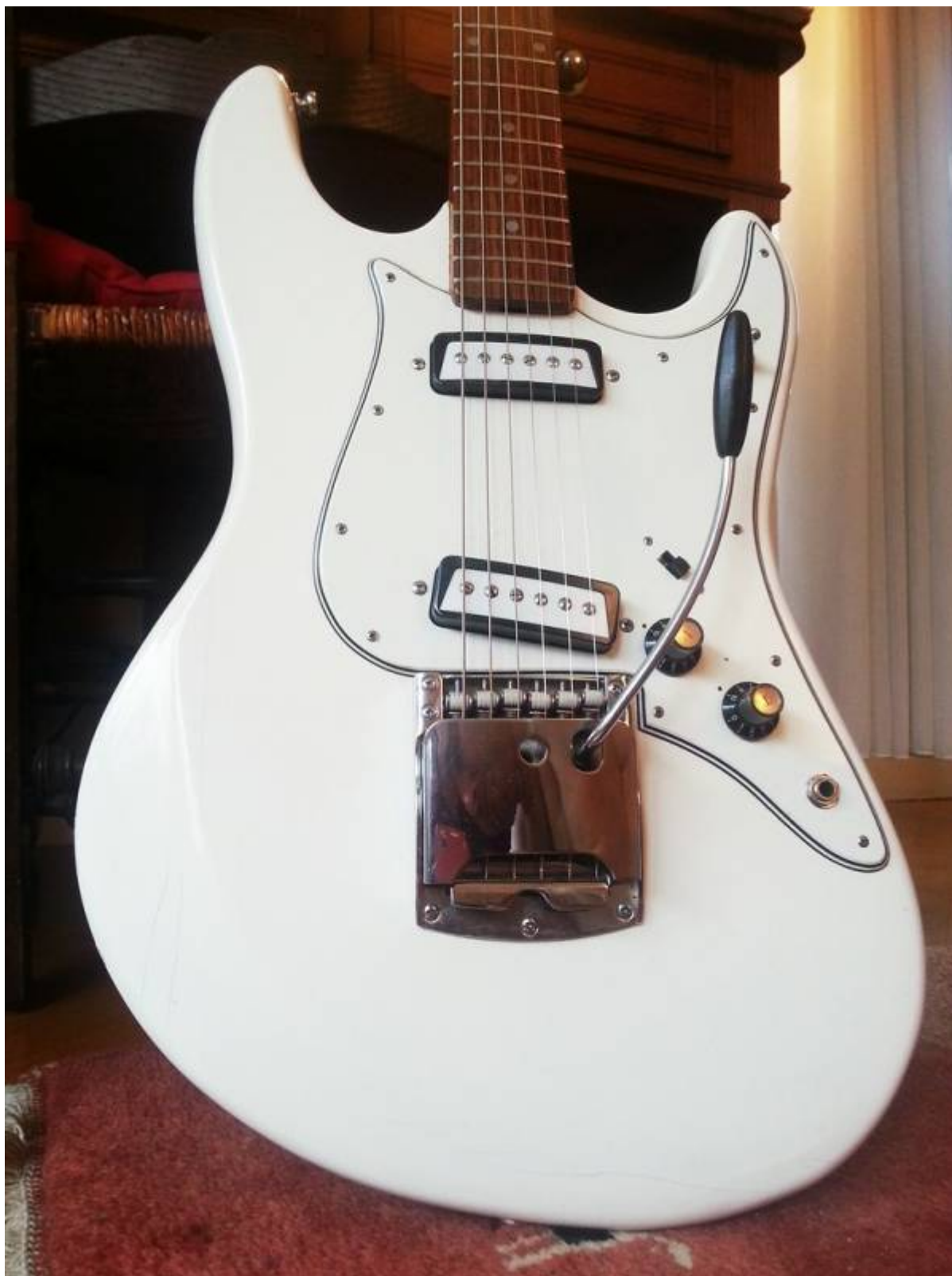
Guitare Ariat 1802T, vue générale

La 1802T d'Aria est une guitare vintage relativement rare, mais accessible pour un petit prix (j'ai acheté la mienne pour 205 €, frais de port compris, pour un exemplaire en parfait état cosmétique et électrique). Elle est produite à la fin des années 1960 par la société japonaise Aria, en guise de réponse aux célèbres stratocasters de chez Fender.