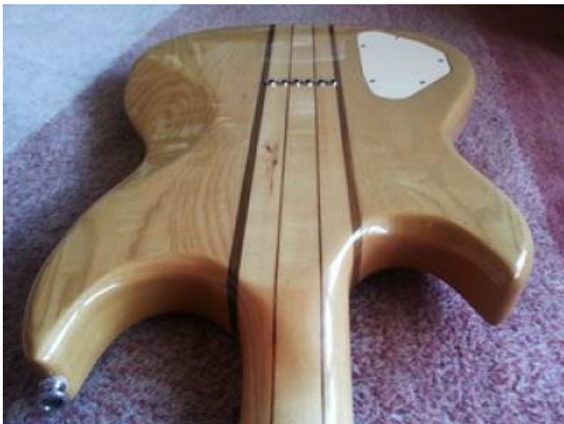
Guitare Aria Pro II TS-600 de 1980 (manche traversant)

Les micros sont des humbuckers Protomatic-III, les micros maison de Matsumoku, au son bien typé, puissant et chaleureux sans être trop sombre, ils excellent dans les saturations mais sont aussi très bons pour des colorations blues dans les sons clairs. Le chevalet permet une intension précise de chaque corde, et le sillet de tête est en laiton, ce qui assure une bien meilleure résonance qu'avec un sillet en plastique.