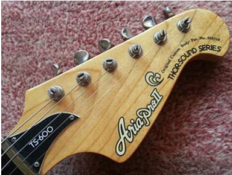
Guitare Aria Pro II TS-600 de 1980 (tête)