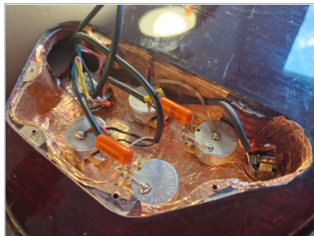
Le circuit électrique de la SG CMI, complètement changé par le luthier Nugz, en 2025