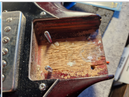
Le "socket" où vient se loger le manche : on distingue les lettres "SG" ainsi qu'un cercle...