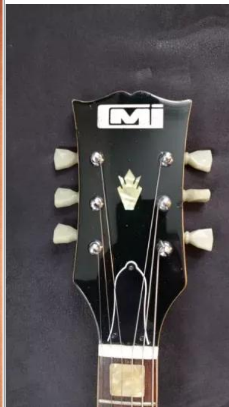
La tête d'une CMI SG avec son logo.