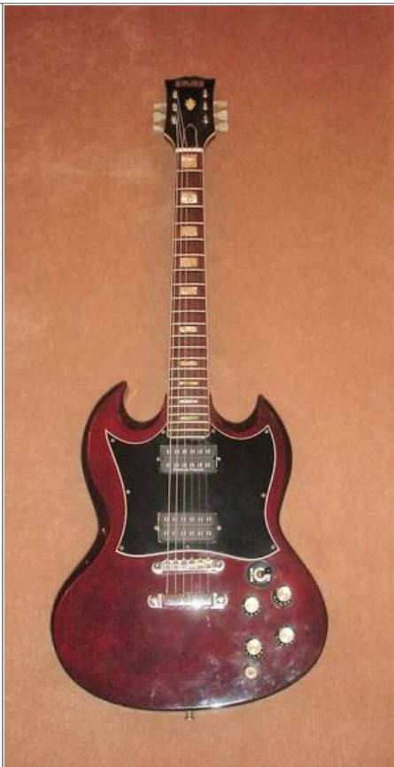
Autre guitare de forme SG et de marque CMI avec son logo encore présent sur la tête.