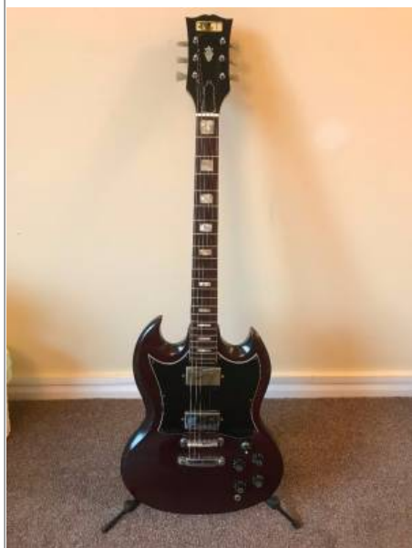
Guitare de forme SG de marque CMI avec son logo encore présent sur la tête.