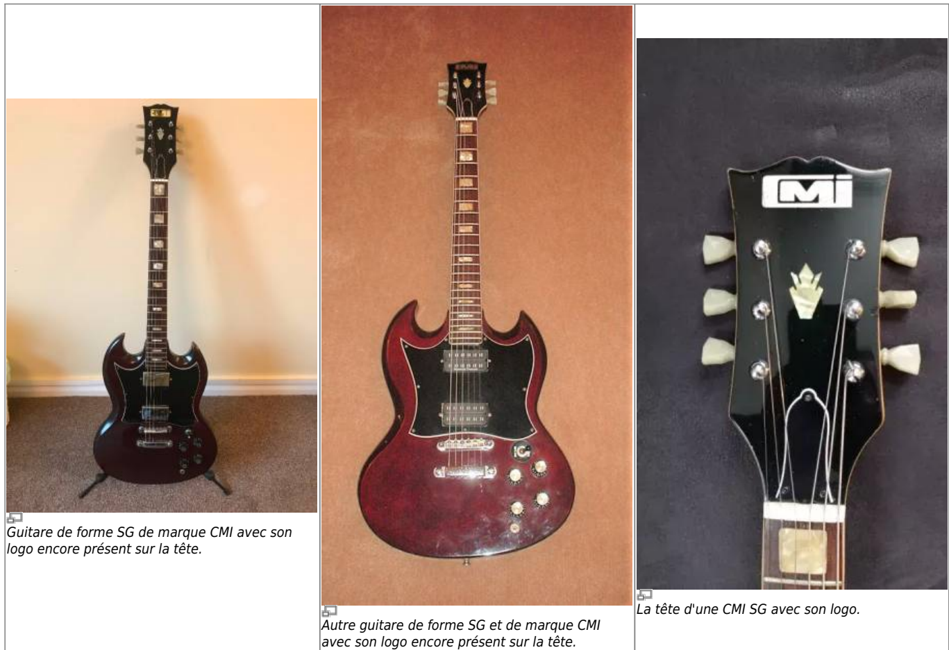
Guitare de forme SG de marque CMI avec son logo encore présent sur la tête.