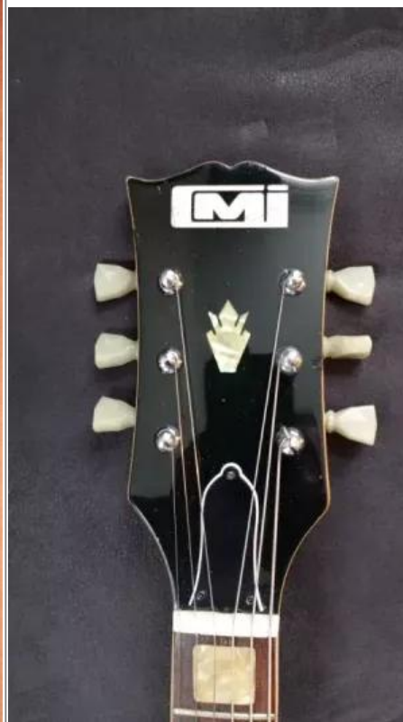
La tête d'une CMI SG avec son logo.