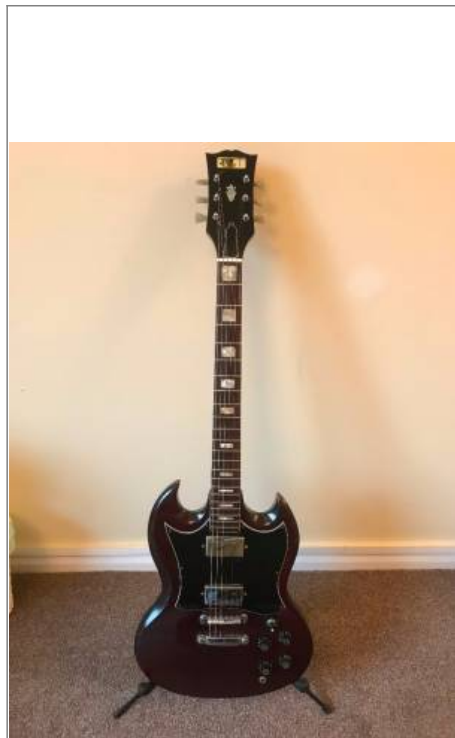
Guitare de forme SG de marque CMI avec son logo encore présent sur la tête.