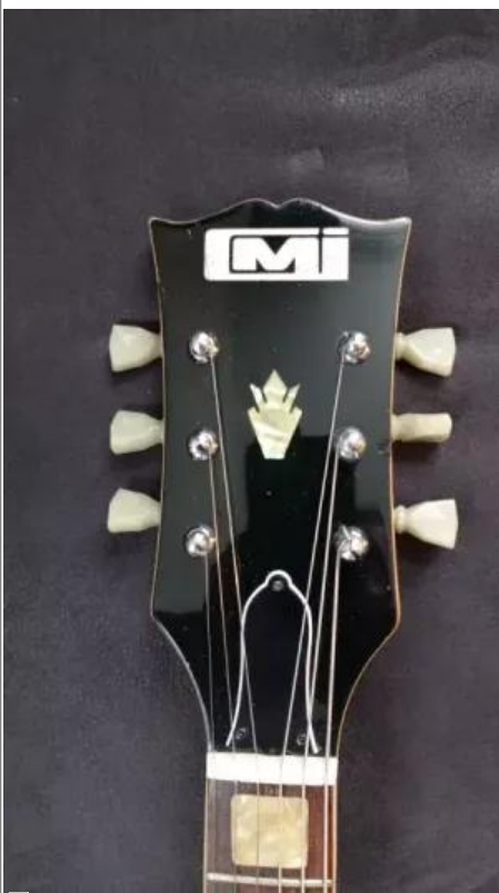
La tête d'une CMI SG avec son logo.