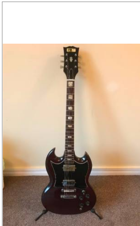
Guitare de forme SG de marque CMI avec son logo encore présent sur la tête.