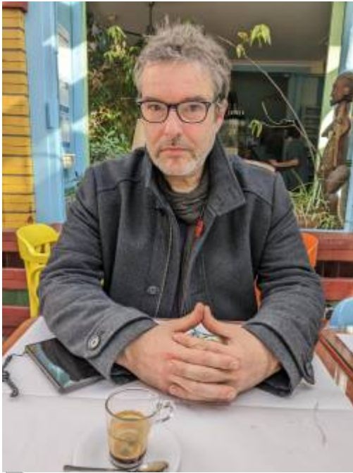
Photo prise dans un café de Montmartre, à Paris, en février 2023.