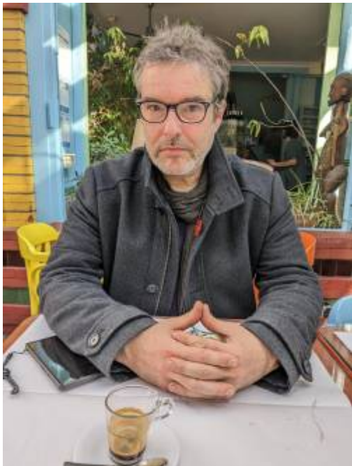
Photo prise dans un café de Montmartre, à Paris, en février 2023.