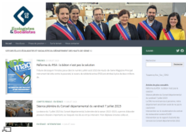
Capture d'écran du site du groupe Écologistes & Socialistes en juillet 2023

Depuis octobre 2021 je suis conseiller technique (c'est le qualificatif affiché à la porte de mon bureau à Nanterre, mais on dit plus volontiers "collab") des élu-es du groupe d'opposition Écologistes & Socialistes au Conseil départemental des Hauts-de-Seine. C'est un travail passionnant et exigeant, qui permet d'accéder à une connaissance fine de nombre de dossiers gérés par la puissance publique à l'échelon départemental, et c'est aussi souvent très technique et demande de nombreuses heures de lectures de rapports, de discussions avec des acteurs locaux des politiques concernées, et de rédactions tout azimut.