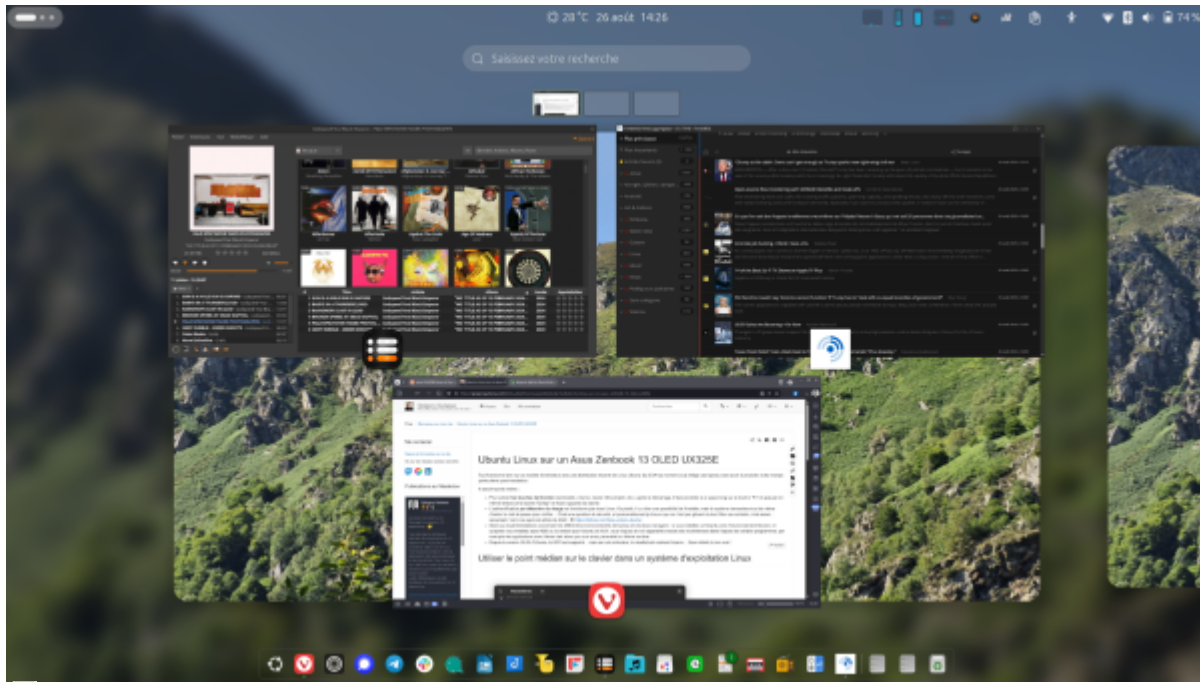
Capture d'écran d'Ubuntu 25.04 sur l'Asus Zenbook 13 OLED, montrant l'environnement de bureau Gnome avec 3 fenêtres ouvertes sur le premier bureau.

Tout fonctionne bien sur ce modèle d'ordinateur avec une distribution récente de Linux Ubuntu (la 25.04 au moment où je rédige ces lignes), sans avoir à procéder à des manipulations particulières post-installation.